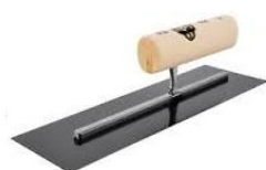
キソッシュベース用