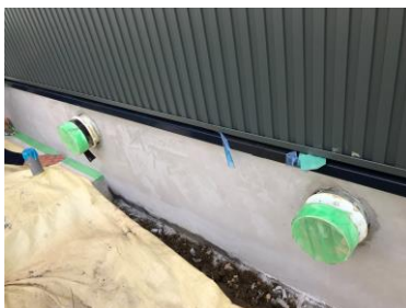
下地清掃 凹凸確認