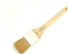
細かい部分の施工用